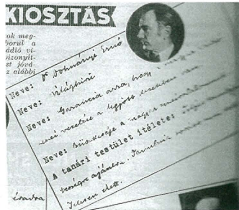
10. kép: Dohnányi „bizonyítványa” (1936)