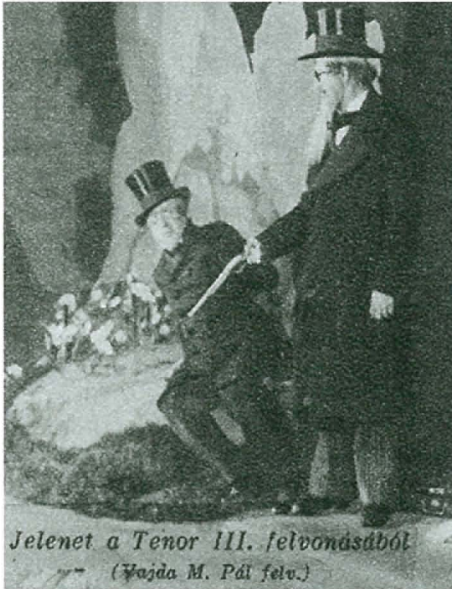
7. kép: A tenor. Jelenet a III. felvonásból (1936)