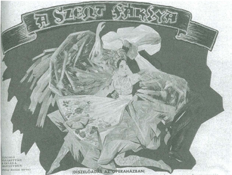
2. kép: A Szentfalkya díszelőadásának közvetítéséhez (1934)