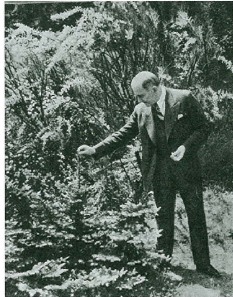
8. kép: A művész és a kert (1936)