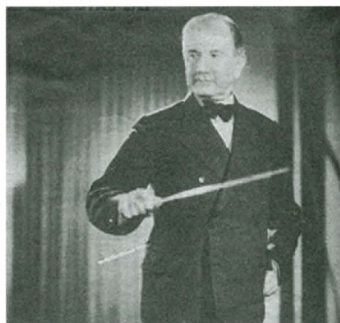
4. kép: Dohnányi vezényel (1935)